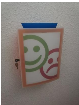
Der Kummerkasten im Flur, beim Eingang des Jugendtreffs