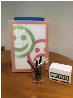
Kummerkasten der Ev. Kirche Herchen im Gemeindehaus